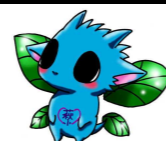
【マスコットキャラ萩ドラ】

夏休み中、子供たちに大きな事故やケガもなく、2学期を無事にスタートすることができたことを大変嬉しく思います。