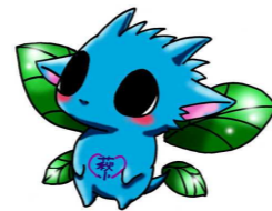
【マスコットキャラ萩ドラ】