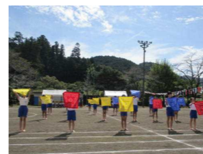
【SIN・進・信・伸・真へ心をひとつに 4～6年生】