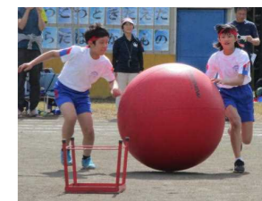
【全校暴れんボール将軍(大玉送り)】