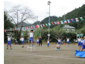
【開幕宣言～本日デビューHagi小町 1～3年生】